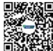
扫码观看祝福视频