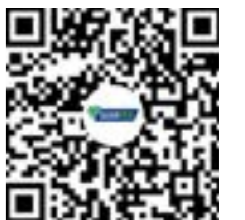
扫码观看祝福视频