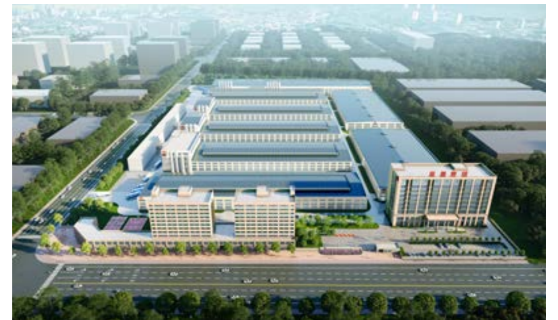
▲ 思嘉（福清）智慧产业园

未来，思嘉将继续集中核心资源，开展更多新材料产业项目研发，加强产业关键核心技术和前沿技术研究，并巩固人才、产能、质量管理、设备与工艺先进性等创新支撑体系，优化企业技术研发创新管理机制，向“成为全球高性能复合新材料领先者”的愿景迈进！