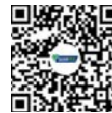
扫码观看祝福视频

For a long time, Sijia Group "made the low carbon design and technology innovation as the core, is dominated by new functional materials, is committed to leading the industry development of ecological industry chain, provides technical consultation and service for the industry, provides new material with super core building materials products in the modern transportation, construction, health, outdoor recreation and sports competition, and many other areas, with Sijia new materials and super core building materials products, and its business covers more than 100 countries and regions." After 20 years of hard work, your company has achieved remarkable results and become the industry leader!