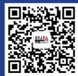
思嘉超能芯公众号