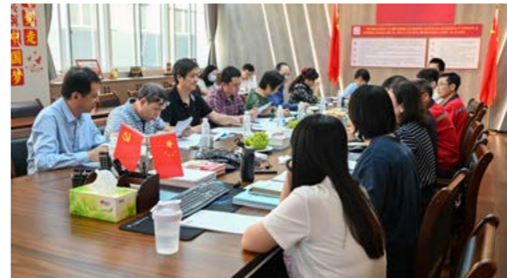
▲ 研发项目中期绩效评价会议

技术研发孕育了一系列知识产权成果，公司目前已获百余项国家授权专利，专利质量与数量逐年上升。如今，公司已成为国家高新技术企业、国家级专精特新“小巨人”企业、国家知识产权优势企业。